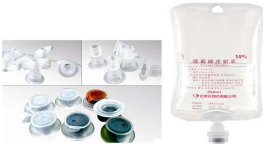
图 1 带有胶塞的多层共挤输液袋

保证输液袋自身材质不溶出颗粒的同时，也需要保证所使用的袋口胶塞材质在穿刺过程中无脱屑现象，例如使用聚异戊二烯胶塞，其与药液接触时安全可靠。另外，胶塞处各位置被针尖穿刺时需要的穿刺力是否合适，决定了输液时成功穿刺的次数及时间。通常越少的穿刺次数及较短的穿刺时间，可有效避免胶塞不溶性微粒物进入药液内。所以，对于胶塞穿刺力的监测是输液袋产品关键质量性能，穿刺力过大则易导致不易被刺穿，增加穿刺次数及时间，穿刺力过小说明胶塞在运输及储存时易破损。