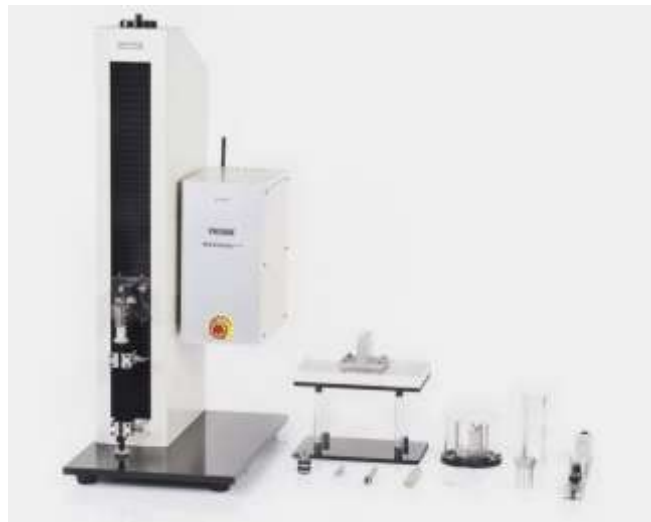
图 2 MED-01 医药包装性能测试仪

本文采用济南兰光机电技术有限公司自主研发的 MED-01 医药包装性能测试仪搭配相关试验夹具进行输液袋穿刺力的测试。