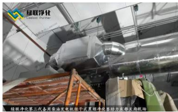
成都天府机场备用柴油发电机组尾气治理现场