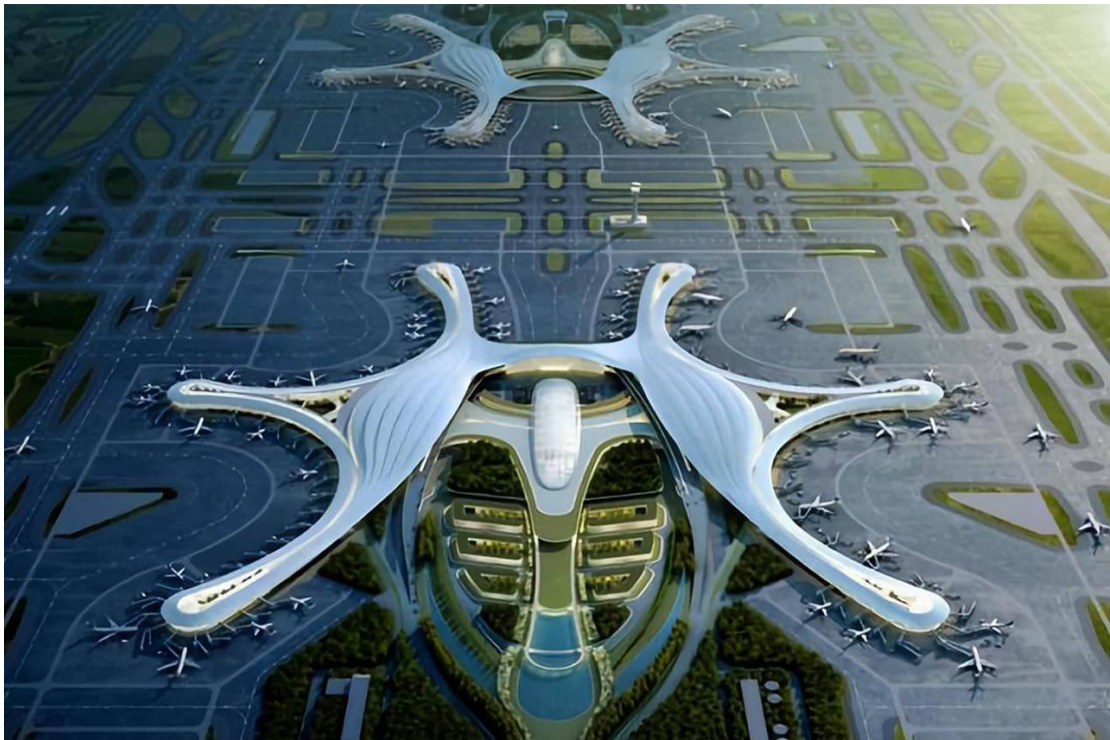
成都天府国际机场

6月27日，成都天府国际机场正式投运。成都成为中国内地第三个拥有两个国际枢纽机场的城市。机场航站楼构型取意具有成都特色的太阳神鸟，航站区内四座单元式航站楼犹如四只驮日飞翔的神鸟，寓意着古蜀文明在成都这片神奇土地上历经三千余年的延续、传承和生长，成都天府机场以自信高昂的姿态面向世界腾飞。为解决航站区电扶梯，登机桥及弱电UPS的用电需求，成都天府机场航管、终端、塔台、雷达站、导航台等场地的设备设施配置了超过30台套应急备用柴油发电机组，功率涵盖880kW-2200kW。在保障机场各基础设备设施用电需求的同时，柴油发电机组启动时的排放问题也需要妥善解决。