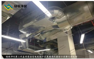
成都天府机场备用柴油发电机组尾气治理现场