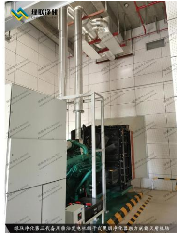
成都天府机场备用柴油发电机组尾气治理现场