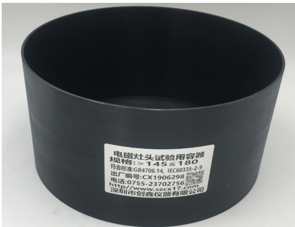
图 104 电磁灶头试验用容器

注：容器由低碳钢制成, 最大含碳量为 0.08%, 不带手柄和突起的圆柱体。底部平面区域的直径至少为烹饪区域的直径。容器底部的最大凹度 C 为 0.006d , d 是底部平面区域的直径。容器的底部不是凸的。